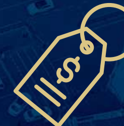
Oferta szyta na miarę