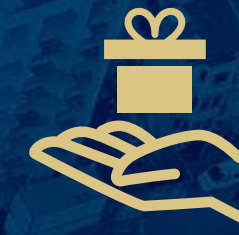
Premie i bonusy