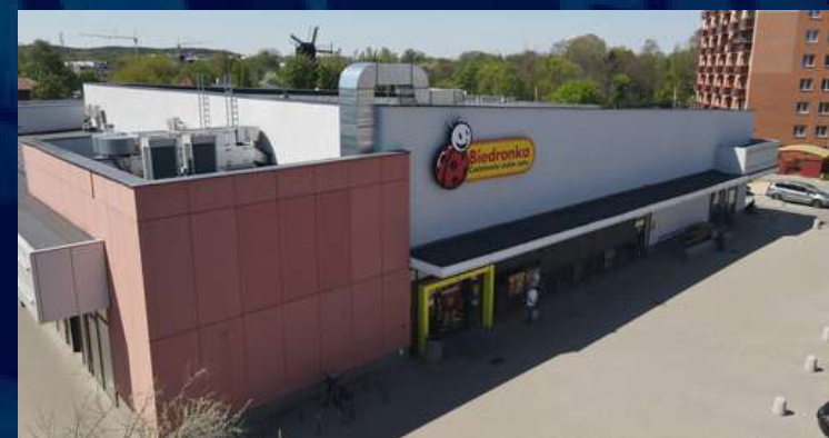
Retail Park 4320 m 2