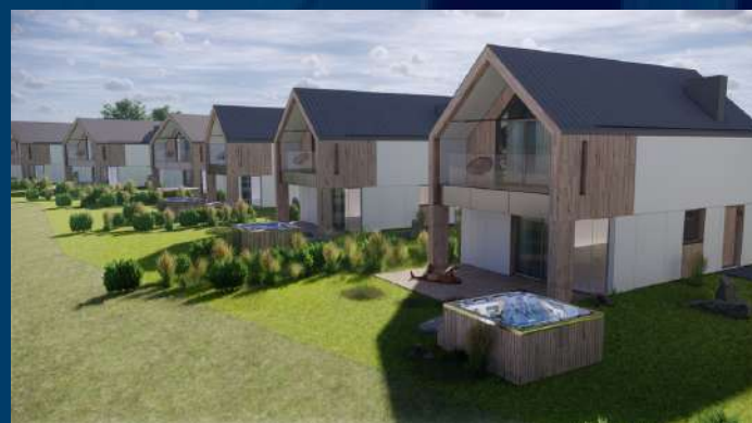
27 domów jednorodzinnych