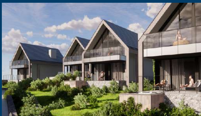
22 domy jednorodzinne