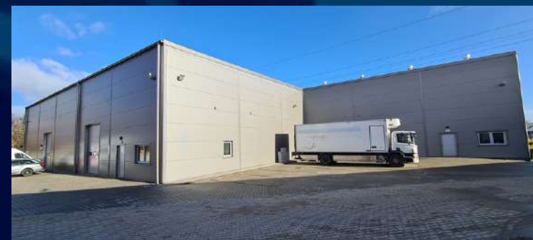
Magazyny 6400 m 2