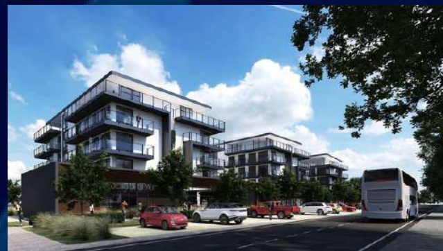
78 mieszkań 3 lokale usługowe